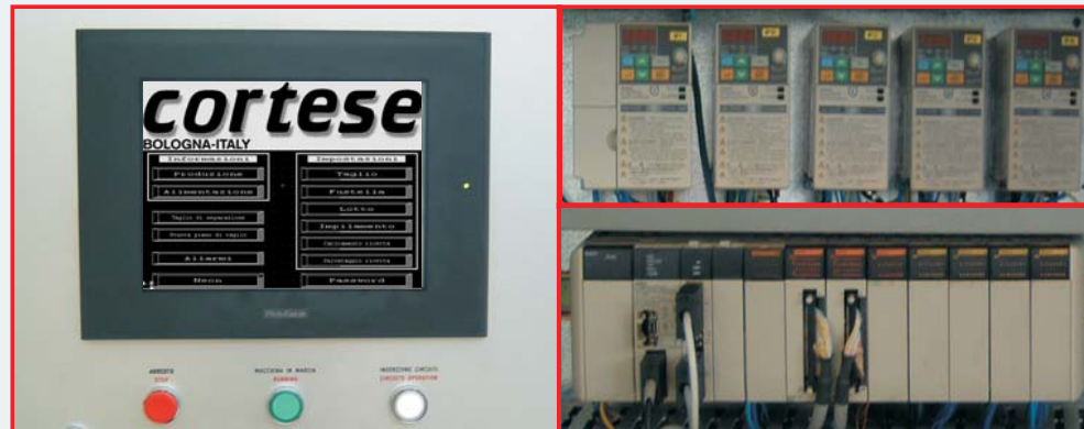
Software integrato completo di autodiagnosi e Hardware con tecnologia PLC, touchscreen e memory cards