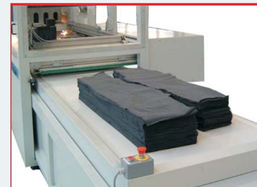
Grande stabilità ondulatoria del nastro di uscita prodotto tagliato Great undulatory stability of the unloading belt for the cut pieces