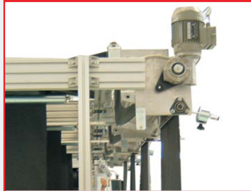
Controllo automatico della tensione del tessuto Automatic control of the tension of the fabric