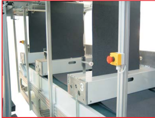
Sovrapposizione automatica del tessuto durante il trasporto nella zona di taglio tramite nastro motorizzato Automatic overfeeding of the fabric during the transport to the cutting area via motorized belt