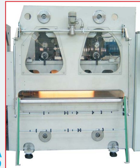
PRESSA CUTTING HEAD